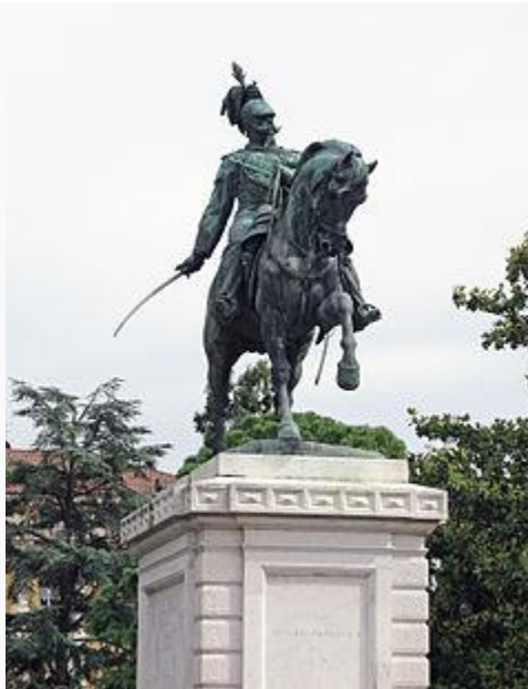
Pomnik Wiktora Emanuela II w Weronie

Wyprawa tysiąca zakończyła się sukcesem. Garibaldi opanował Sycylię i ogłosił jej przyłączenie do królestwa Wiktora Emanuela II. 27 lipca Garibaldi zajął Mesynę a 19 sierpnia wylądował w Kalabrii. Wiktor Emanuel II w oficjalnym liście zakazywał Garibaldiemu inwazji na kontynencie, a w prywatnym liście wręcz do niej zachęcał. Prowadził potrójną grę wobec Garibaldi, Cavoura i Napoleona III. Garibaldi rozpoczął inwazję na Neapol, który ostatecznie zajął bez walki i większego oporu 7 września 1860 roku. Na zajętych terenach jak poprzednio przeprowadzono plebiscyt i jak poprzednio większość opowiedziała się za natychmiastową inkorporacją południowych prowincji do królestwa Wiktora Emanuela II [9] . Resztę wojsk Franciszka II rozbito na przełomie 1860 i 1861 roku. W październiku Garibaldi spotkał się z królem Wiktorem Emanuele, pozdrawiając go tytułem króla Włoch . W marcu 1861 roku Senat i Izba Deputowanych ogłosiły powstanie Zjednoczonego Królestwa Włoch i koronowano Wiktora Emanuela II na króla Włoch.