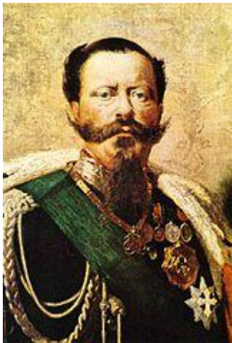
Wiktor Emanuel II z Bożej łaski król Włoch

https://pl.wikipedia.org/wiki/Wiktor_Emanuel_II