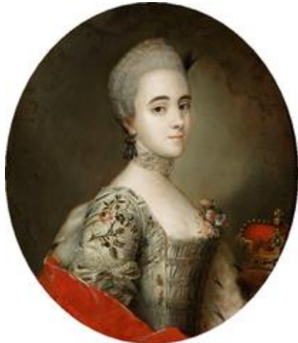
Franciszka Kasińska na obrazie pędzla Pera Kraffta (starszego)