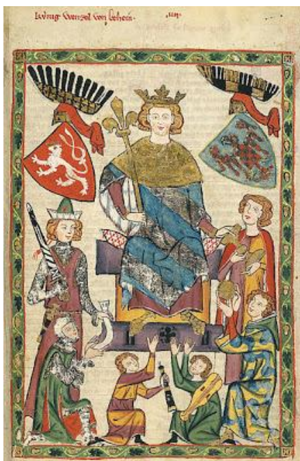
Wacław II Czeski, źródło: Wikimedia.

księżniczka skończyła zaledwie 3 lata. Niestety, narzeczony zmarł pomiędzy 1297 a 1299 rokiem. Mimo tego wiadomo było, że mała księżniczka nie będzie narzekać na brak adoratorów. Była bowiem córką króla, a jej przyszły mąż mógł liczyć na koronę. Zainteresował się nią i postanowił poślubić król Czech Wacław II, który ubiegał się o tron polski i w listopadzie 1300 roku został koronowany w Gnieźnie na króla Polski.