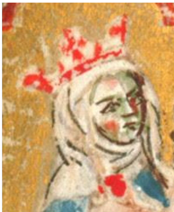
Elżbieta Ryksa

Była jedynym dzieckiem króla Przemysła II i jego ukochanej żony, szwedzkiej królowej Ryksy (Rychezy). Mimo smutnego dzieciństwa i niezbyt szczęśliwej młodości, gdyż zanim skończyła dwadzieścia lat, zdążyła już dwukrotnie owdowieć i stracić narzeczonego, została królową Czech i jako pierwsza przedstawicielka dynastii Piastów, zasiadła na polskim tronie. Okazała się wprost stworzona do swej roli. Miała silny charakter, nieprzeciętny intelekt i hart ducha, którego zazdrościł jej niejeden władca. Wzbudzała miłość poddanych, szacunek wrogów, a jej zasługi dla kultury Czech są ogromne. Pewne czeskie miasto o nazwie Hradec, na jej cześć zaczęto nazywać Hradec Králové. Do dziś w tym mieście pamięć o "pięknej Polce", królowej Elżbiecie jest wciąż żywa. Chociaż stare przysłowie mówiło, że szczęście nie jest przeznaczeniem królowych, ona odnalazła je w miłości. Dziś w Polsce znana jest w gruncie rzeczy tylko historykom-mediewistom, choć, mimo, że z Polski wyjechała jako mała dziewczynka, to jednak do końca życia zachowała pamięć o Poznaniu, Wielkopolsce i grobie rodziców w poznańskiej katedrze. Oto opowieść o Elżbiecie Ryksie, królowej Czech i Polski.