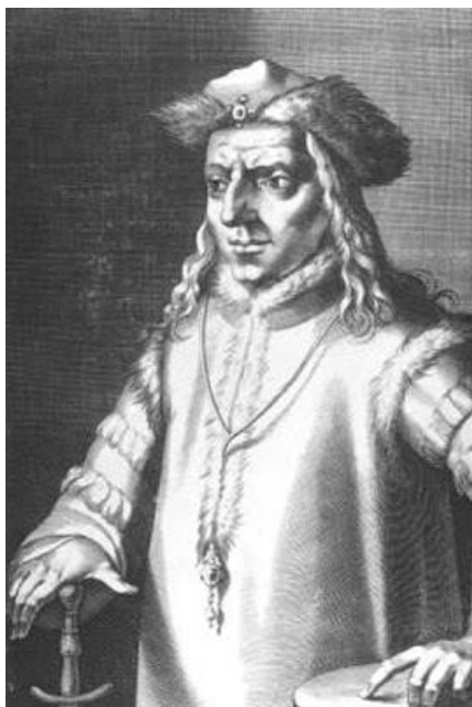
Rudolf Habsburg

Pretensje do tronu czeskiego zgłosił książę karyncki Henryk, zięć Wacława II i Rudolf, syn króla rzymskiego (niemieckiego), Albrechta I Habsburga. Czechy stanowiły lenno Rzeszy Niemieckiej i Albrecht po prostu nadał to lenno synowi. Aby wzmocnić prawa Rudolfa do korony czeskiej, Albrecht wyznaczył synowi Elżbietę Ryską na żonę.